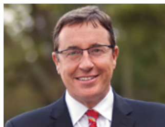
Achim Steiner - Administrador del Programa de las Naciones Unidas para el Desarrollo (PNUD)