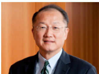
Jim Yong Kim - Presidente del Banco Mundial (Banco Mundial)