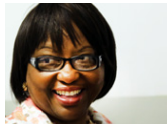
Carissa F. Etienne - Directora de la Organización Panamericana de la Salud (PAHO)