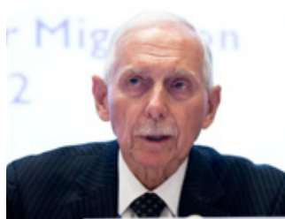
William Lacy Swing - Director General de la Organización Internacional para las Migraciones (OIM)