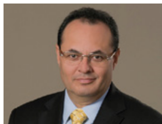
Luis Carranza Ugarte - Presidente Ejecutivo del Banco de Desarrollo de América Latina (CAF)