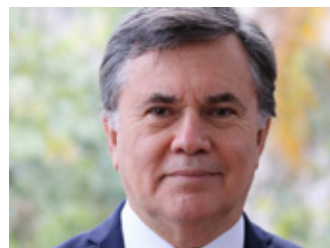
Manuel Otero - Director General del Instituto Interamericano de Cooperación para la Agricultura (IICA)