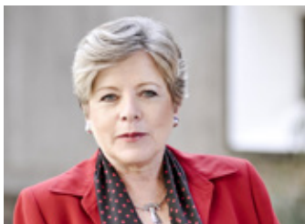
Alicia Bárcena Ibarra - Secretaria Ejecutiva de la Comisión Económica para América Latina y el Caribe (CEPAL)