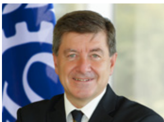
Guy Ryder - Director General de la Organización Internacional del Trabajo (OIT)