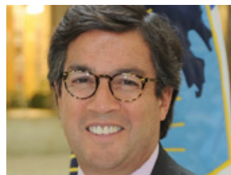
Luis Alberto Moreno - Presidente del Banco Interamericano de Desarrollo (BID)