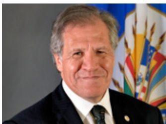
Luis Almagro - Secretario General de la Organización de los Estados Americanos (OEA)