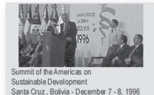
Summit of the Americas on Sustainable Development Santa Cruz, Bolivia - December 7 - 8, 1996

Después de lograr un consenso sobre este asunto, e incluir elementos sociales, económicos y ambientales dentro del entendimiento del desarrollo sostenible, también se logró