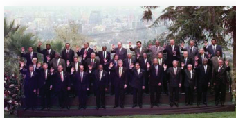
Foto Oficial de la Segunda Cumbre de las Américas. Santiago, Chile, 1998.

La Primera Cumbre fue convocada por un Presidente estadounidense, y la Cumbre sobre Desarrollo Sostenible por uno boliviano. La Segunda Cumbre de las Américas se caracterizó por ser el primer encuentro de este tipo convocado por decisión de todos los Jefes de Estado y de Gobierno. Se desarrolló en 1998 en Santiago de Chile, y contó con la participación activa de organizaciones subregionales como el CARICOM y el Grupo de Río. Adicionalmente, las negociaciones fueron apoyadas por el Grupo de Revisión de la Implementación de las Cumbres (GRIC) , la Organización de Estados Americanos (OEA), el Banco Interamericano de Desarrollo (BID), la Organización Paramericana de la Salud (OPS) y la Comisión Económica para América Latina y el Caribe (CEPAL).