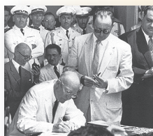
Presidente estadounidense Dwight Eisenhower en la Cumbre de Panamá, 1956.

Una se realizó en Ciudad de Panamá, Panamá, el 22 de julio de 1956 . Asistieron 19 líderes de diferentes países y con ella se esperaba fortalecer a la OEA como fuerza clave para el desarrollo económico y social de la región. Entre los resultados de esta Cumbre se encuentran: el establecimiento de comités para el estudio de los problemas críticos del hemisferio, la adopción de la Declaración de Panamá para promover la libertad humana y aumentar el nivel de vida, y el establecimiento de las bases para la creación del BID y para la Alianza para el Progreso.