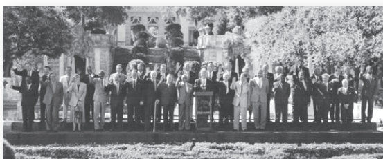
Foto Oficial de la Primera Cumbre de las Américas. Miami, Florida, 1994. Fuente: www.summit-americas.org/i_summit_sp.html

Esto permitió que en diciembre del mismo año se reunieran en la ciudad de Miami, Estados Unidos, 34 líderes de las Américas elegidos democráticamente (los Estados miembros activos a la fecha). Esta vez también se incluyó a los mandatarios de Canadá y de las islas Estados del Caribe.