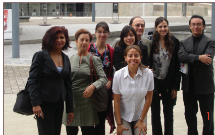
Reunión de la Red Democracia Activa en el marco de la XXXVIII Asamblea General de la OEA en Medellín, Colombia, 2008.

Posteriormente, se efectuó una evaluación de este proceso y se resolvió desarrollar una iniciativa de seguimiento al grado de cumplimiento de los Gobiernos sobre determinados mandatos contenidos en la sección de “Gobernabilidad Democrática” del Plan de Acción de Quebec. Para tal fin, se procedió a elaborar una metodología que permitiría ampliar la cobertura de este proyecto a más países. Esta etapa es lo que ya se mencionó en dicho apartado anterior como “ Estrategia de Seguimiento de la Sociedad Civil a la Implementación del Plan de Acción de Quebec ”.