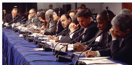
Foro Subregional de América del Sur. Lima, Perú, febrero 6 y 7 de 2009.