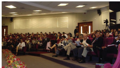
Foro Hemisférico "Hacer realidad los beneficios de la democracia". Washington, abril 11 y 12 de 2005.