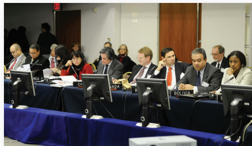
III Reunión Ordinaria del GRIC. Washington, febrero 23 a 27 de 2009.