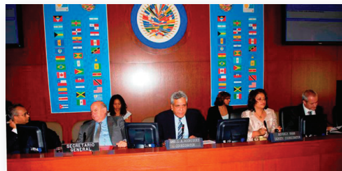
Reunión Ministerial del GRIC. XXXVIII Asamblea General de la OEA. Medellín, Colombia, junio de 2008.