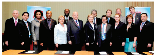
Grupo de Trabajo Conjunto de Cumbres y otros actores en Puerto España, 2009.

También, participan como invitados especiales algunos representantes de la sociedad civil, entre ellos miembros de ONGs, del sector privado, de las instituciones académicas y de los medios de comunicación.