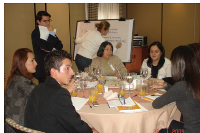
Taller deliberativo, en el Desayuno de Trabajo: Presentación de resultados y ejercicio grupal de formulación de propuestas. Bogotá, enero 23 de 2009.