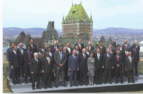
Foto Oficial de la Tercera Cumbre de las Américas. Quebec, Canadá, 2001.

peridad y el desarrollo del potencial humano. Adicionalmente, ésta dio impulso a la creación del Área de Libre Comercio de las Américas (ALCA), y a la creación del Instituto para la Conectividad de las Américas (ICA). El tema prioritario en este documento fue la preparación de la Carta Democrática Interamericana , con el fin de reforzar los instrumentos de la OEA para una defensa activa de la democracia representativa. La Carta se adoptó finalmente en Sesión Especial de la Asamblea General de la OEA el 11 de septiembre de 2001, en Lima, Perú.