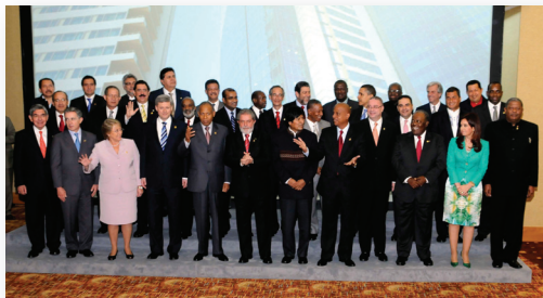
Foto Oficial de la Quinta Cumbre de las Américas. Puerto España, Trinidad y Tobago, 2009.

Además de los temas de la Declaración, la Cumbre se focalizó en el desarrollo de respuestas efectivas a la actual crisis económica mundial , entre éstas el apoyo hemisférico a la recapitalización del BID y otros organismos multilaterales de crédito, como sugerencia de Colombia y otros países, buscando aumentar la financiación para el desarrollo. De igual forma, las deliberaciones estuvieron centradas en la reintegración de Cuba al Sistema Interamericano y en el compromiso de apoyar a Haití.