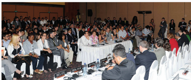
Diálogo de Jefes de Delegación con representantes de la sociedad civil. San Pedro Sula, Honduras, 1 de junio de 2009.

Aprobada en el marco de la XXXIX Asamblea General de la OEA, en San Pedro Sula, Honduras, en el 2009. Reafirmó los compromisos de las Asambleas celebradas anteriormente.