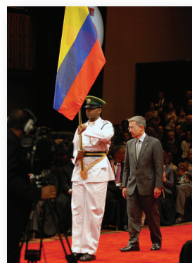
Presidente Uribe en la ceremonia inaugural de la Quinta Cumbre de las Américas.

En el proceso, los países deben presentar informes nacionales anuales, implementados a partir de la Cumbre de Quebec. En ese sentido, Colombia ha venido presentando su Informe Nacional de manera continua desde el año 2003, demostrando su compromiso con el proceso de Cumbres y con la implementación de sus mandatos.