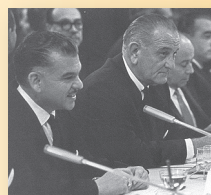
Presidente estadounidense Lyndon B. Johnson en la Cumbre de Punta del Este, 1967.

La otra se llevó a cabo en Punta del Este, Uruguay, del 12 al 14 de abril de 1967 . Asistieron 20 representantes y con ella se esperaba fortalecer la Alianza para el Progreso (iniciativa del Presidente estadounidense John F. Kennedy), para promover el desarrollo y las relaciones pacíficas en las Américas. Entre los resultados de esta Cumbre está la Declaración de los Presidentes de América , que estableció como objetivos la creación de un Mercado Común para América Latina, y la cooperación multilateral de desarrollo de infraestructura, agricultura, control de armas y educación.