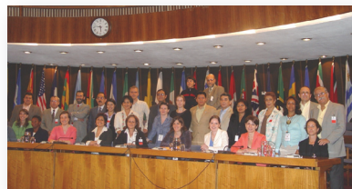
Reunión de la Red Democracia Activa (de organizaciones de la sociedad civil) en la culminación de una reunión de planeación estratégica y coordinación metodológica en la sede de la CEPAL. Santiago, Chile, noviembre de 2006.

Los mandatarios reconocieron por primera vez la importancia de la participación de una sociedad civil diversa en los procesos de Cumbres para el fortalecimiento democrático. Así, se abrió la participación a individuos, partidos políticos, académicos, miembros del sector privado y representantes de las organizaciones no gubernamentales (ONG) de la sociedad civil. Se determinó un marco normativo para que estos actores supervisaran la transparencia y responsabilidad de los procesos. Asimismo, se tomaron medidas para mejorar la calidad de la participación de los grupos tradicionalmente marginados.