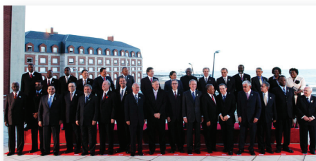
Foto Oficial de la Cuarta Cumbre de las Américas. Mar del Plata, Argentina, 2005.

En los asuntos relacionados con el empleo, los compromisos giraron en torno a la definición de acciones para promover el desarrollo a través de la generación de ofertas laborales, el incremento de la participación ciudadana en este campo, la cooperación entre los Gobiernos, el fomento de un diálogo social incluyente y el impulso de inversiones en áreas claves para la creación de más empleos.