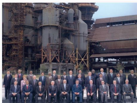
Foto de la Cumbre Extraordinaria de las Américas. Monterrey, México, 2004.

La Declaración de Nuevo León solventó 72 mandatos y se centró en tres temas. El primero de ellos fue el crecimiento económico con equidad para reducir la pobreza . Este punto incluyó propuestas como la creación de un ambiente favorable para el sector privado, la implementación de políticas macroeconómicas, la simplificación de los procedimientos para crear empresa, la triplicación de los préstamos del BID para pequeñas y medianas empresas y la reducción de los costos de remesas internacionales.